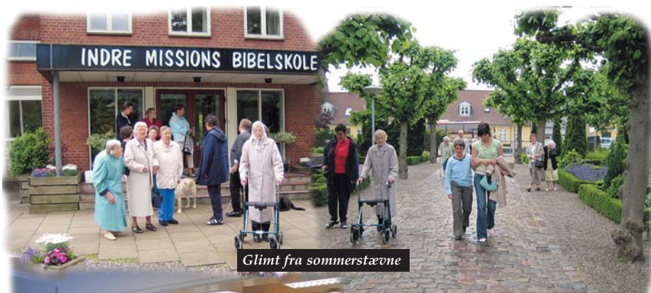
Glimt fra sommerstævne