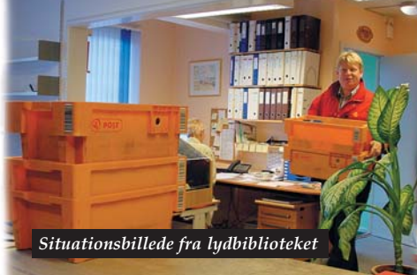
Situationsbillede fra lyd biblioteket