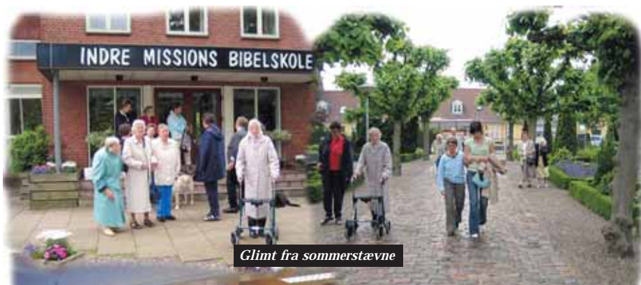
Glimt fra sommerstævne