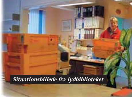
Situationsbillede fra lydbiblioteket