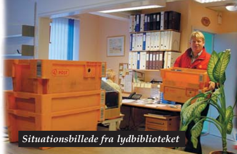
Situationsbillede fra lyd biblioteket